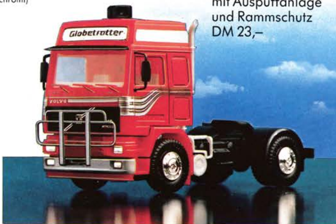
300 128 Volvo F 12 Globetrotter Solo-Zugmaschine mit Auspuffanlage und Rammschutz DM 23,-

500 113 NEU – Rammschutz (2 x) für Volvo F10 – F16 DM 4,50 500 114 NEU – Rammschutz (2 x) für Volvo F10 – F16 DM 6,50 (verchromt)