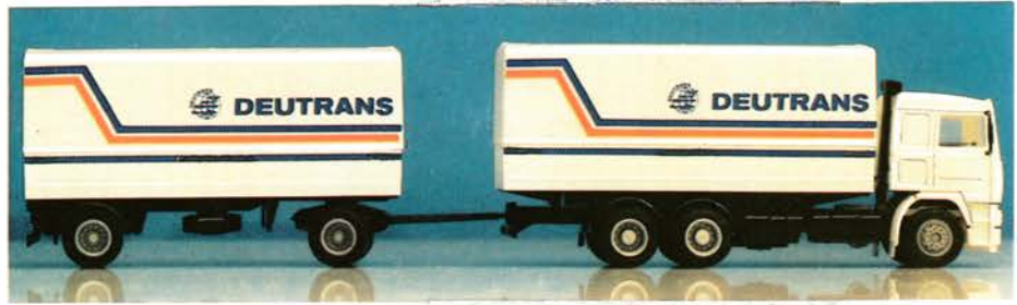
300 119 Volvo F 12 Hängerzug „Deutrans“ DM 26,-