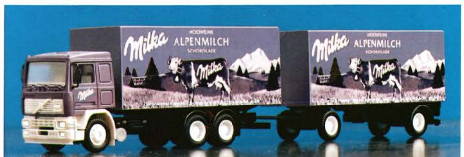
300 124 Volvo F12 Hängerzug „Milka Alpenmilch-Schokolade“ DM 29,50