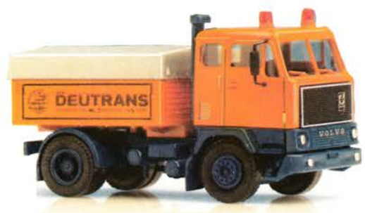
116 122 Volvo F 89 Schwerlast-Zugmaschine „Deutrans“ DM 17,50