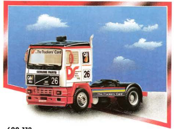
600 113 Volvo F 16 Renn-Truck „... The Truckers Card“ Nürburgring 1989, Start-Nr. 26 Fahrerhaus schabloniert, neues Fahrerhaus DM 29,50