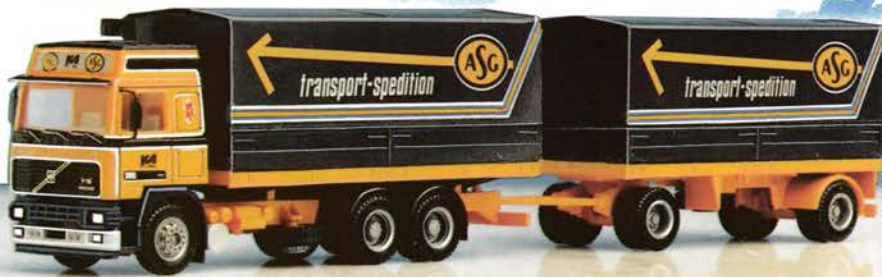
300 126 Volvo Globetrotter Hängerzug „ASG-Spedition“ DM 29,50