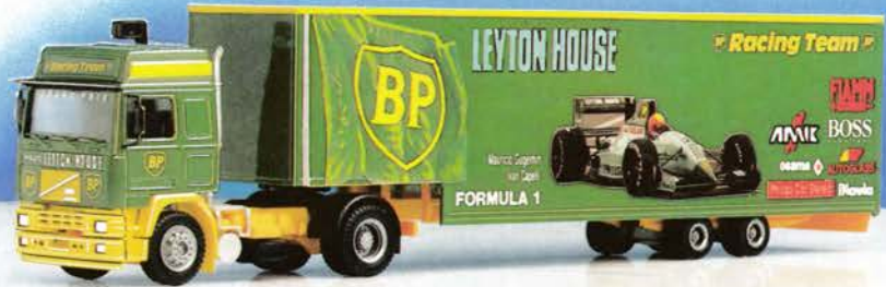
300 131 Volvo Globetrotter Rennttransporter „BP“ neues Fahrerhaus DM 31,50