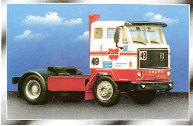
600 112 Volvo F 89 Renn-Truck „Würth“ Nürburgring 1990 Start-Nr. 49 DM 26,-