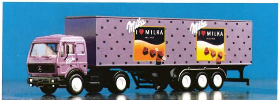
200 220 DB Sattelzug „I love Milka“ DM 31,-