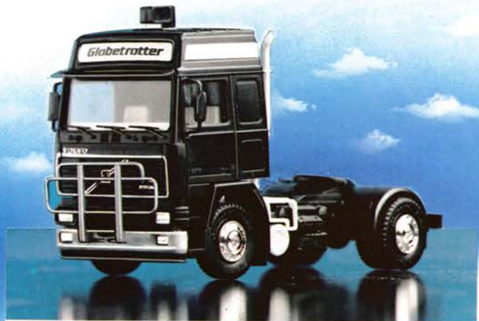
300 129 Volvo F 16 Globetrotter, Solo-Zugmaschine mit Auspuffanlage und Rammschutz DM 23,-