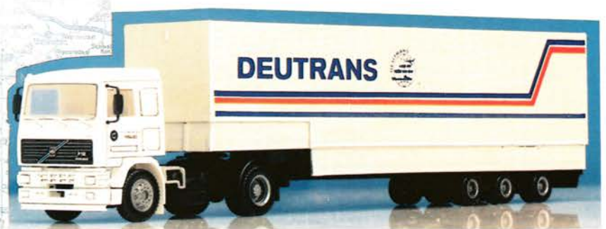
300 120 Volvo F 12 Jumbo-Sattelzug „Deutrans“ DM 26,-

ALBEDO-FORKEL GMBH POSTFACH 11 55 · W-8807 Heilsbronn