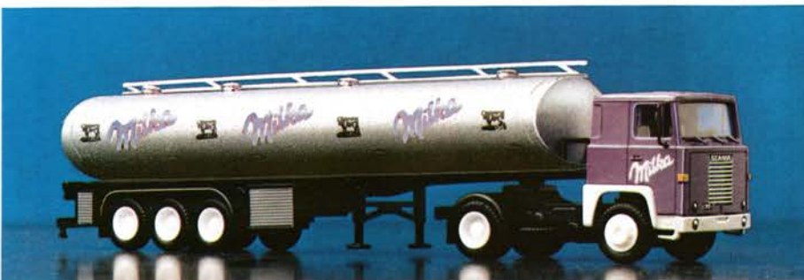
111 117 Scania 111 neuer Milchtankauflieger DM 28,-