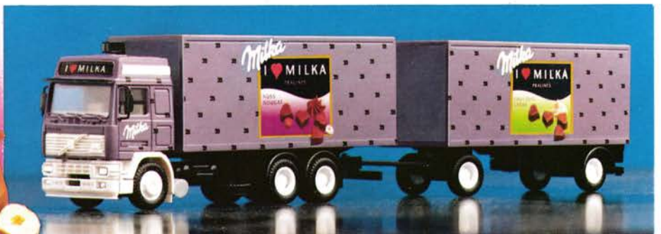
300 123 Volvo Globetrotter Hängerzug „I love Milka“ DM 35,-