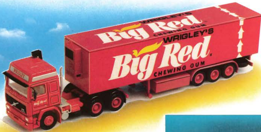
300 122 Volvo F 12 Globetrotter Sattelzug „Wrigleys Big Red“ DM 29,-