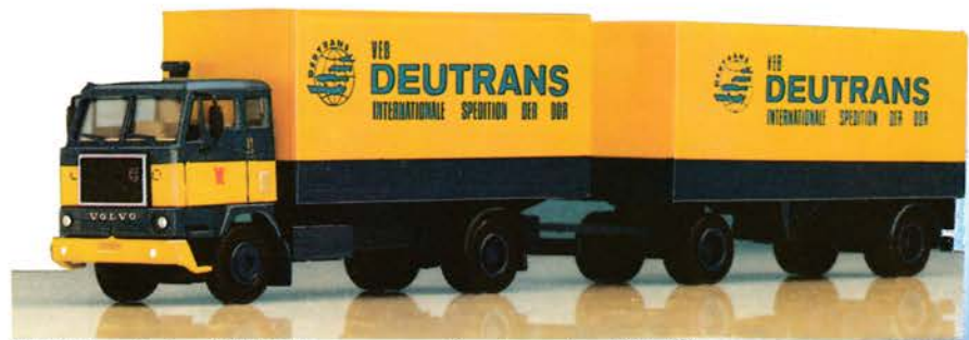
116 121 Volvo F 88 Hängerzug „Deutrans“ DM 26,-