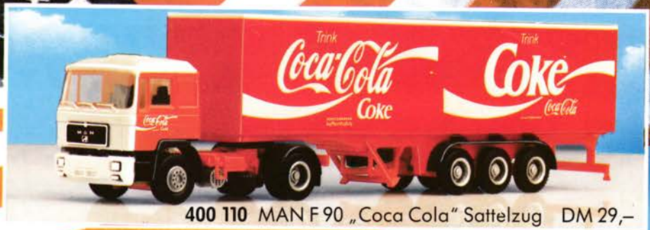
400 110 MAN F 90 „Coca Cola“ Sattelzug DM 29,-