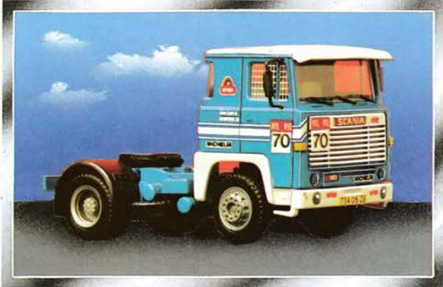
600 114 Scania Renn-Truck „RTL“ Le Mans 1984 DM 26,-