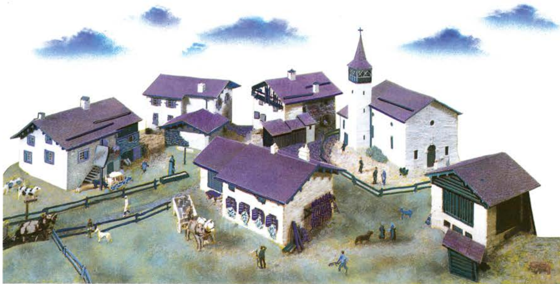
501 000 Das „Milka-Dorf“ DM 129,- Bausatz 1:87, 5 Häuser, 1 Kirche, diverses Zubehör ohne Figuren (Kibri-Basis)