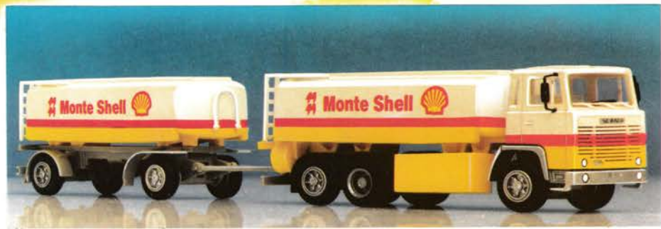
111 116 Scania 111 Tankhängerzug „Monte Shell“ DM 28,-