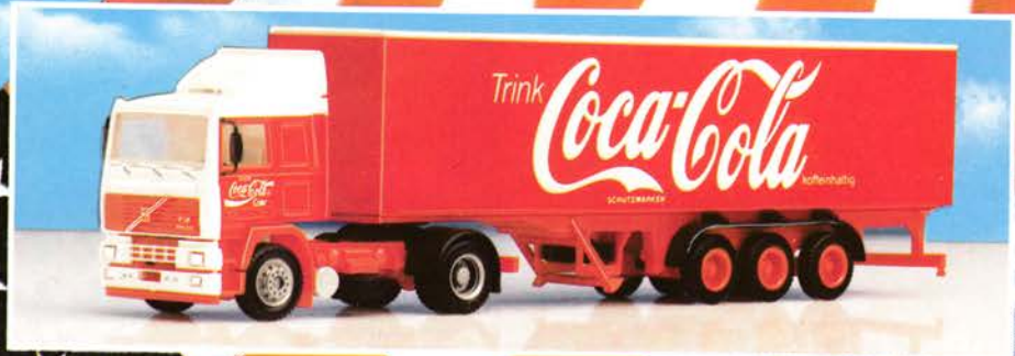
400 110 MAN F 90 „Coca Cola“ Sattelzug DM 29,-