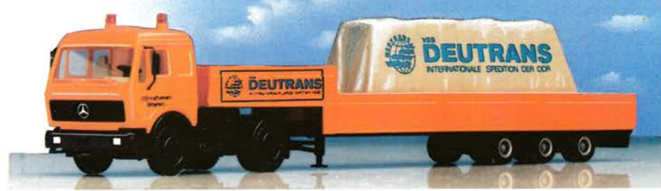
200 219 DB Schwerlasttransport mit neuer Plane (Ladegut) „Deutrans“ DM 26,-