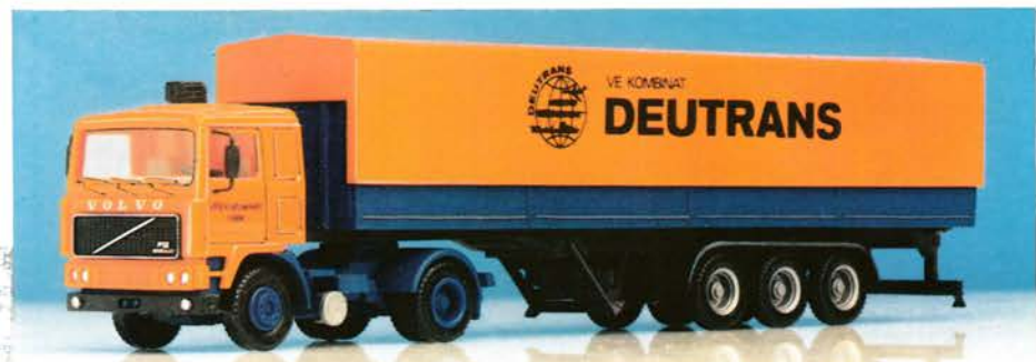
200 218 Volvo F 12 Sattelzug „Deutrans“ DM 23,-