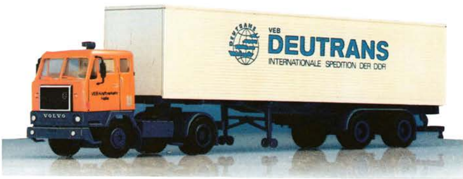
116 120 Volvo F 88 Sattelzug „Deutrans“ DM 23,-